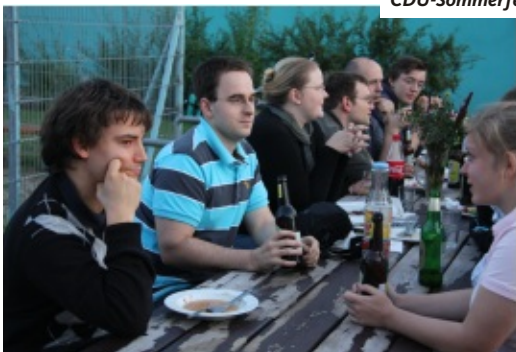
CDU-Sommerfest im September