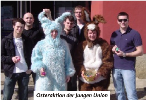
Osteraktion der jungen Union