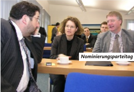
Nominierungsparteitag zur Kommunalwahl im März