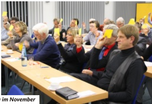
Kreisparteitag im November