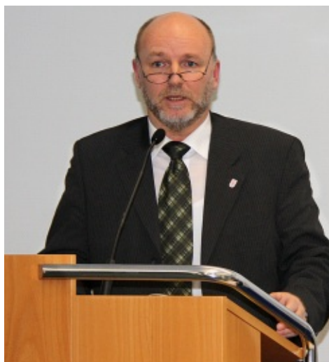
Egbert Liskow, Präsident der Greifswalder Bürgerschaft und Landtagsabgeordneter