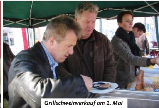
Grillschweinverkauf am 1. Mai