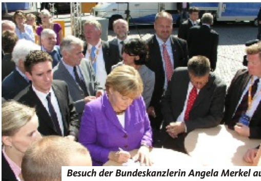
Besuch der Bundeskanzlerin Angela Merkel auf dem Markt zum Europawahlkampf am 1. Juni