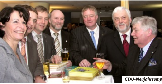
CDU-Neujahrsempfang im BiG