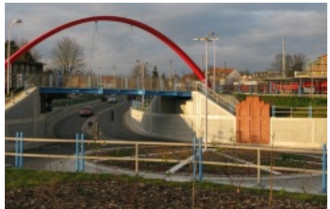
Seit einem Jahr nutzbar – die Unterführung am Bahnhof

Aber warum dieser ganze Aufwand? Nach der Eisenbahn Bau- und Betriebsordnung ist vorgesehen, dass auf Strecken, auf denen Züge mit mehr als 160 km/h verkehren, keine höhengleiche Bahnquerungen vorhanden sein dürfen. Da der InterCity, der von Berlin nach Stralsund fährt, zu der Klasse der Züge gehört, die schneller als 160 km/h fahren dürfen, wurde ein Umbau der Strecke notwendig.