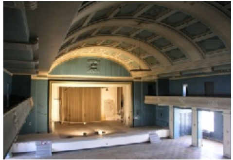
Der „Kaisersaal“ vor der Sanierung

Die Bauarbeiten verliefen nahezu ohne Komplikationen, was jedoch nicht immer das Umfeld der Stadthalle betraf. So wird beispielsweise derzeit noch um den Namen der Stadthalle gestritten. Die Greifswalder Bürgerschaft hat mittlerweile das Entscheidungsrecht und soll sich demnächst auf einen Namen festlegen. Auch ist noch kein Betreiber für das