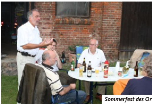
Sommerfest des Ortsverbandes Altstadt